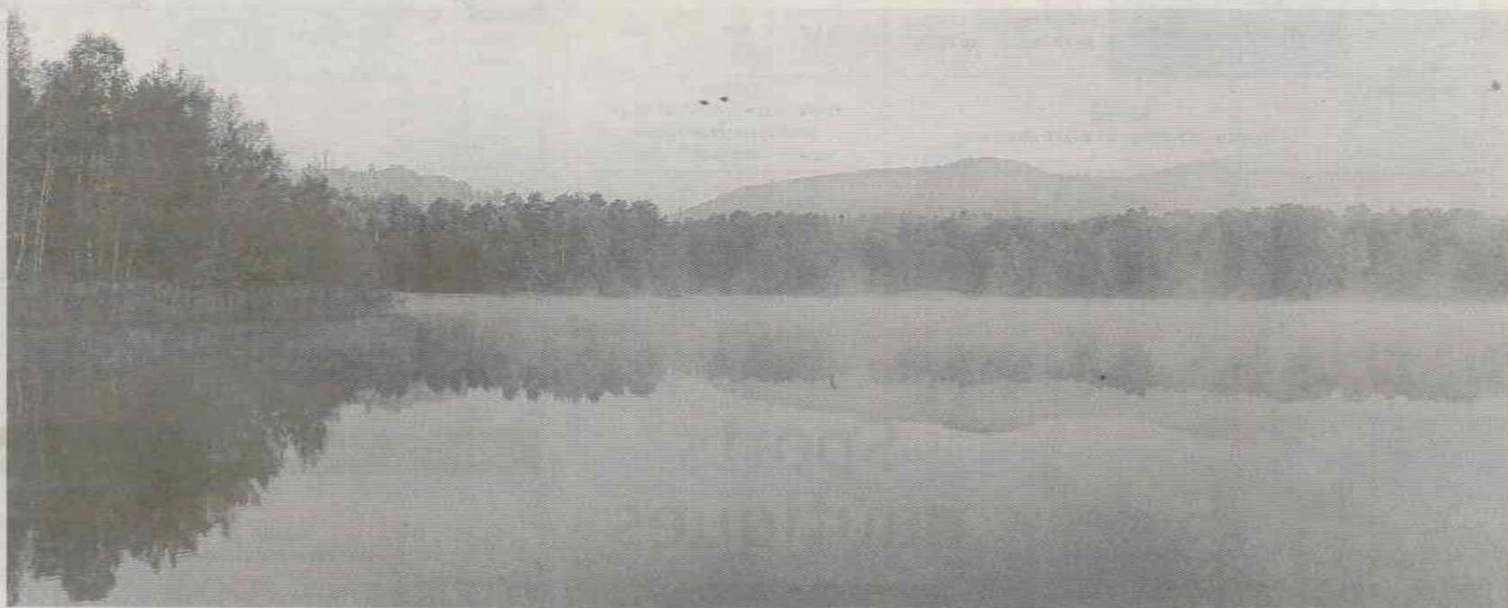
Une vue de l'étang de Hanau, zone humide à préserver.

En parallèle, des gerbes d'« Étincelles poétiques » enflammeront bientôt le secteur. « Il s'agit de débarquer sur la place publique, à toutes sortes d'occasions, pour surprendre les habitants avec des textes », explique Brigitte. Pour faire jaillir ces gerbes, elle compte sur les comédiens d'un