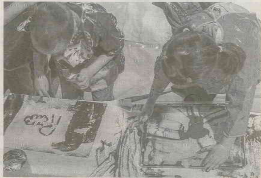
Petits et grands réaliseront une œuvre collective.

L'œuvre sera visible à l'occasion du 20 e anniversaire de la réserve naturelle des rochers et des tourbières du pays de Bitche, les 25 et 26 août, flottant sur l'étang de Hanau. Le premier rendez-vous est fixé à l'atelier municipal de Baerenthal, samedi 16 juin de 10 h à 18 h. Le second aura lieu à la médiathèque de Bitche, vendredi 22 juin de 14 h à 19 h et samedi 23 juin de 10 h à 17 h. Le troisième sera à Éguelshardt, au stand de tir de Schindelkehl, samedi 30 juin de 10 h à 18 h. Enfin, le dernier est prévu à Philippsbourg, au camping de l'étang de Hanau, le dimanche 1 er juillet de 10 h à 18 h.